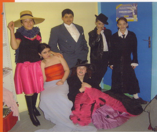
Tous ces personnages servent de support aux publicités!